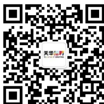
天华招聘微信公众号